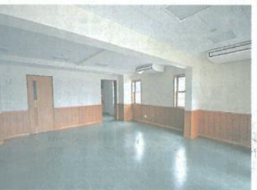
コミュニティホール